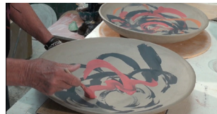
Plats d'Art. Guardó del Memorial Àlex Seglers

Aquestes creacions han estat possibles gràcies al compromís i inspiració de les reconegudes artistes, amb la coordinació del Museu d'Art de Sabadell i el suport del Servei de Drets Civils.