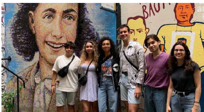
La Raquel durant la seva visita a l'Anne Frank Zentrum a Berlín

Les pràctiques finals de màster las vaig fer en el departament educatiu del Museu del Disseny de Barcelona i l'experiència em va fer descobrir la possibilitat de treballar en l'educació no formal, que mai m'ho havia plantejat. Així que quan vaig trobar aquesta oferta en el departament educatiu de la casa museu no ho vaig dubtar i em vaig apuntar.