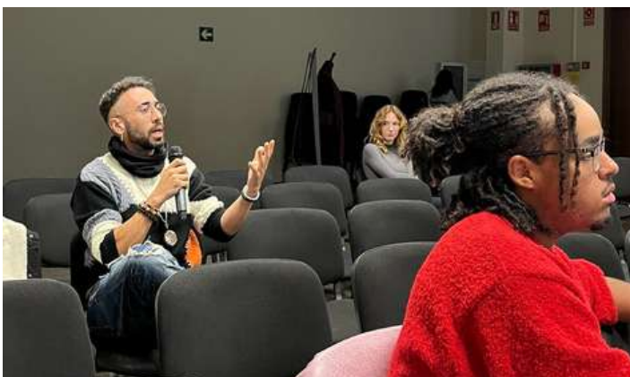
El participant intervenint en l'acte a Sabadell pel Dia Internacional de Solidaritat amb el poble palestí.

A nivell personal, he après a valorar el que és essencial i a gestionar situacions de gran intensitat emocional amb més calma. A nivell professional, ha redefinit el meu propòsit com a artista. Ara entenc l'art no només com a estètica, sinó com una eina d'intervenció social imprescindible.