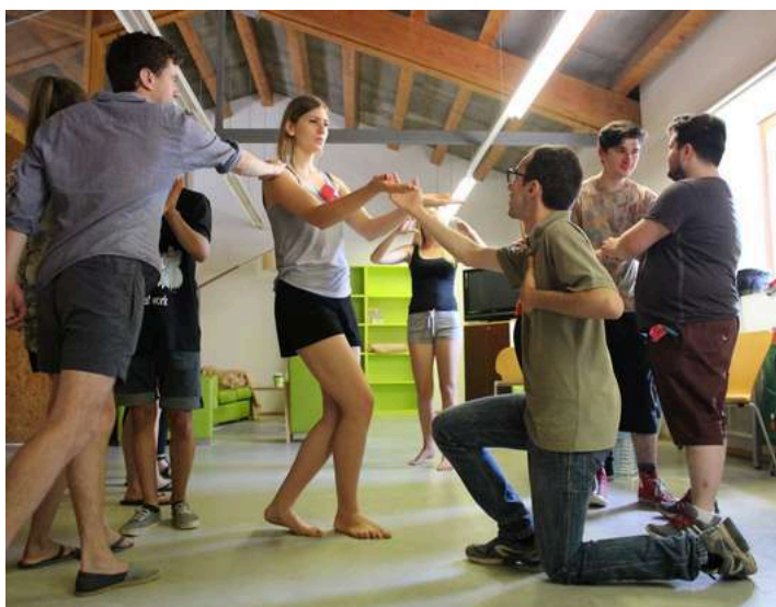
El jove participant d’un intercanvi juvenil a Sabadell.

Pensa que encara mantinc contacte amb alguna de les persones amb què vaig compartir projecte i això és extraordinari! A més, l’idioma vehicular dels intercanvis era l’anglès i això va fer que en una setmana millorés moltíssim l’idioma.