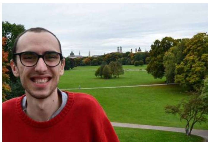
El Miquel porta nou anys vivint a Alemanya.