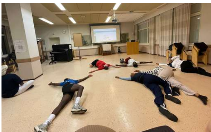
La voluntària dinamitzant una activitat al centre.

Les experiències fora de la rutina, com conduir sota tempestes de neu o treballar en grans esdeveniments comunitaris, m'han ensenyat resiliència i adaptabilitat. Però el més especial ha estat construir relacions genuïnes amb els estudiants, els meus col·legues i els altres voluntaris.