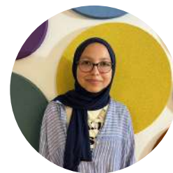
Nureşan - Turquia

En quin espai jove estàs fent el voluntariat i en quin municipi?