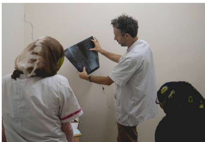
El traumatòleg fent formació als campaments sahrauís.

El principal repte va ser començar a fer docència i assistència en un context en què no s'havia fet, pel que fa a la traumatologia. A més, no sabia quines serien les demandes de la població, i quin seria el material mèdic amb el qual comptaria.