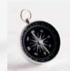
Instruccions per al dia de la prova