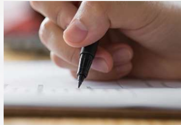
Sobre les PAU