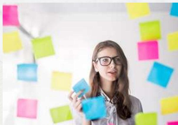
Sobre les proves d'aptitud personal (PAP) gen Canal Universitats