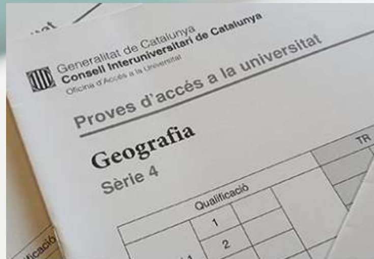
Models d'exàmens d'anys anteriors