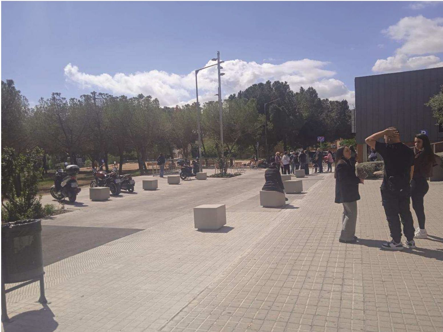
P6_L2-20210927-2 Actuaciones infraestructura Gran Vía-Balcó Ripoll para peatonalizar espacio público y calmar tráfico Nº de expediente: PRTRMU-21-00205