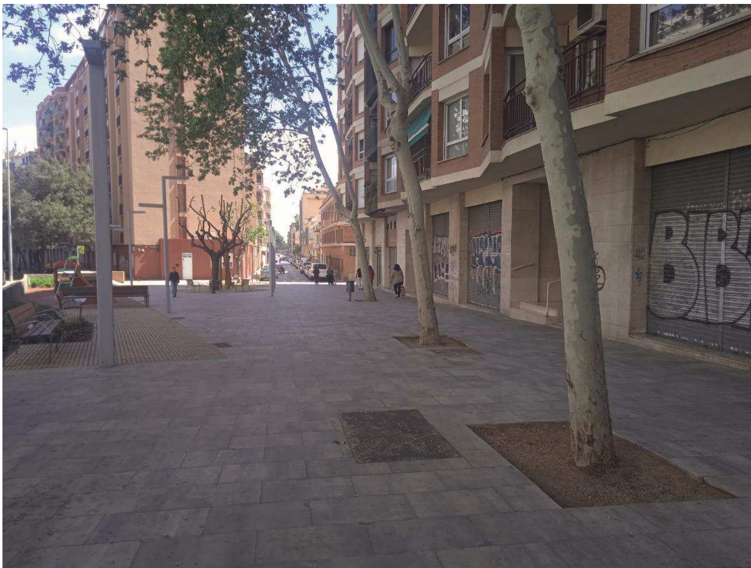
P6_L2-20210927-2 Actuaciones infraestructura Gran Vía-Balcó Ripoll para peatonalizar espacio público y calmar tráfico Nº de expediente: PRTRMU-21-00205