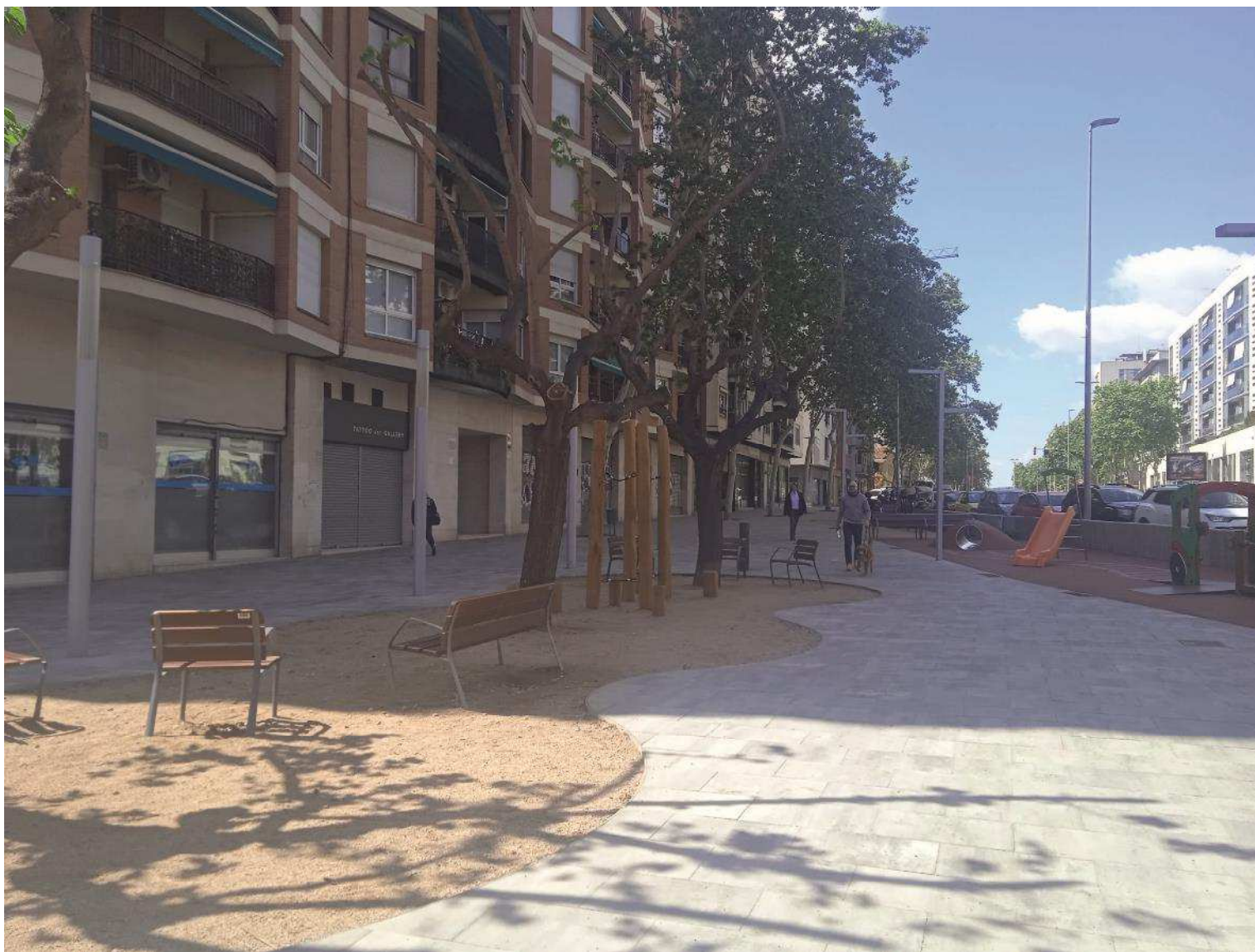
P6_L2-20210927-2 Actuaciones infraestructura Gran Vía-Balcó Ripoll para peatonalizar espacio público y calmar tráfico Nº de expediente: PRTRMU-21-00205