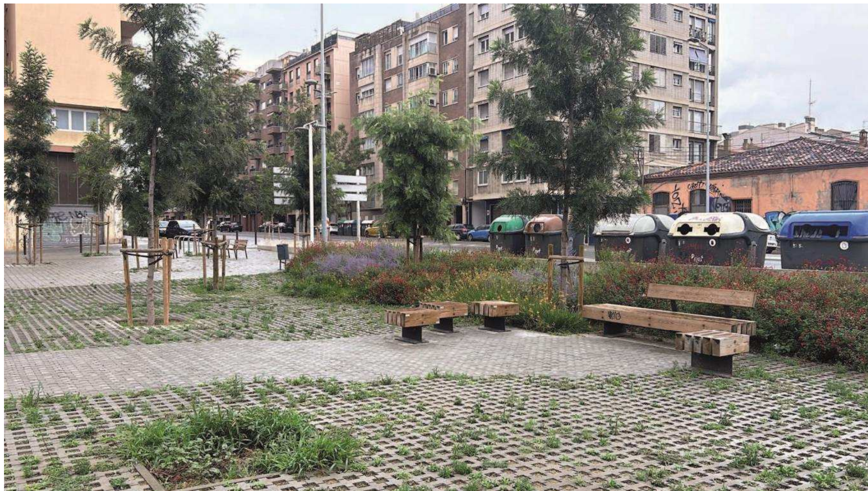
Antes y después (*)