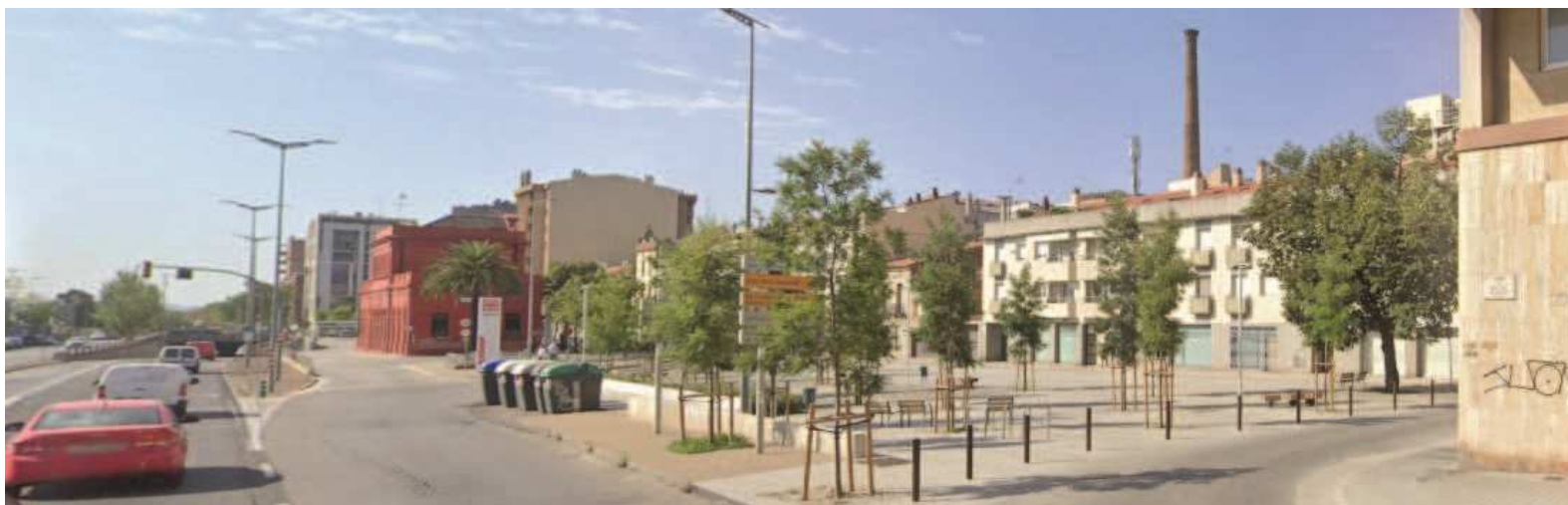
Antes y después (*)