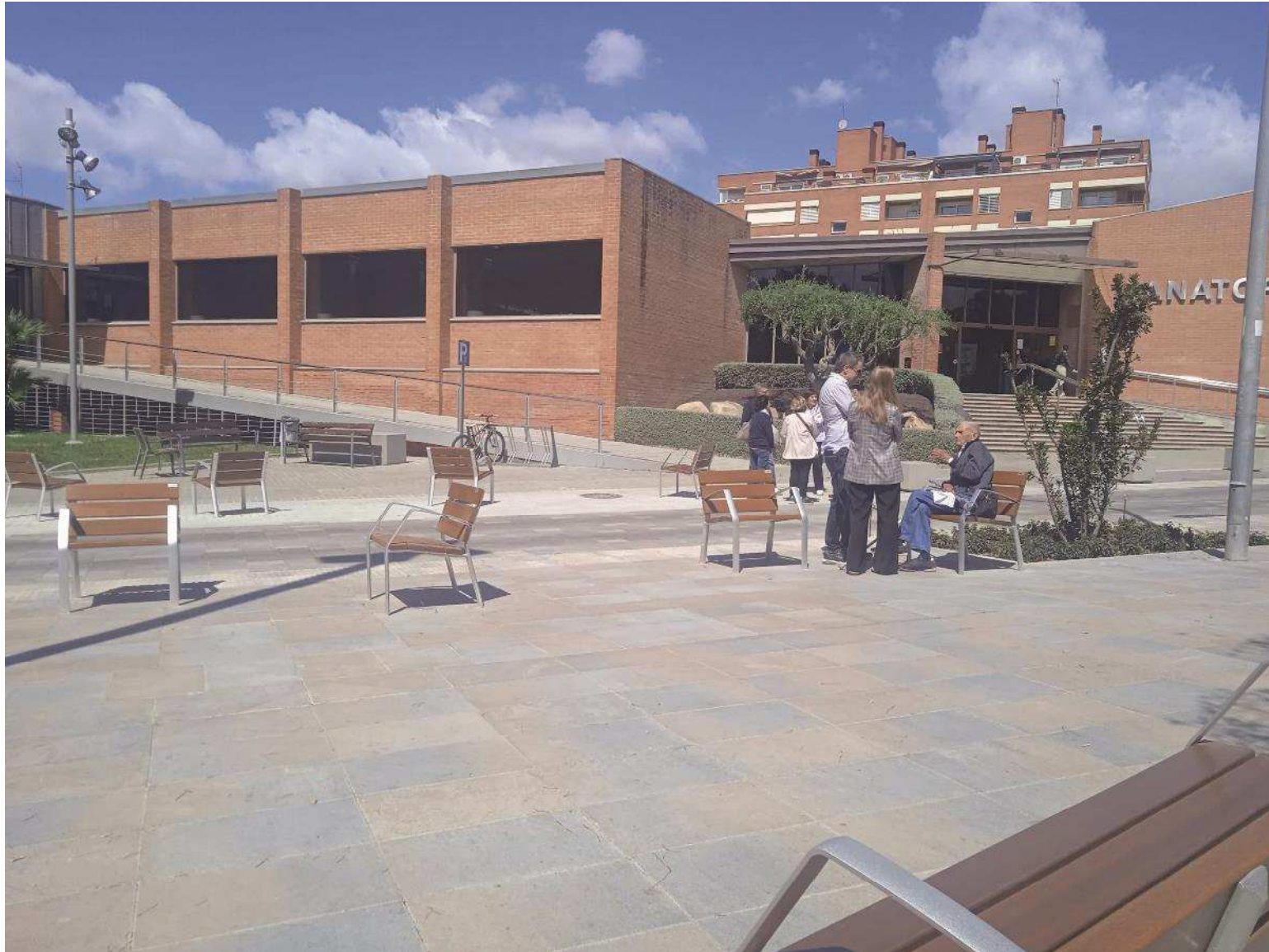
P6_L2-20210927-2 Actuaciones infraestructura Gran Vía-Balcó Ripoll para peatonalizar espacio público y calmar tráfico Nº de expediente: PRTRMU-21-00205