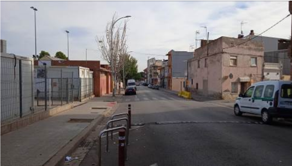
Imagen previa a la actuación