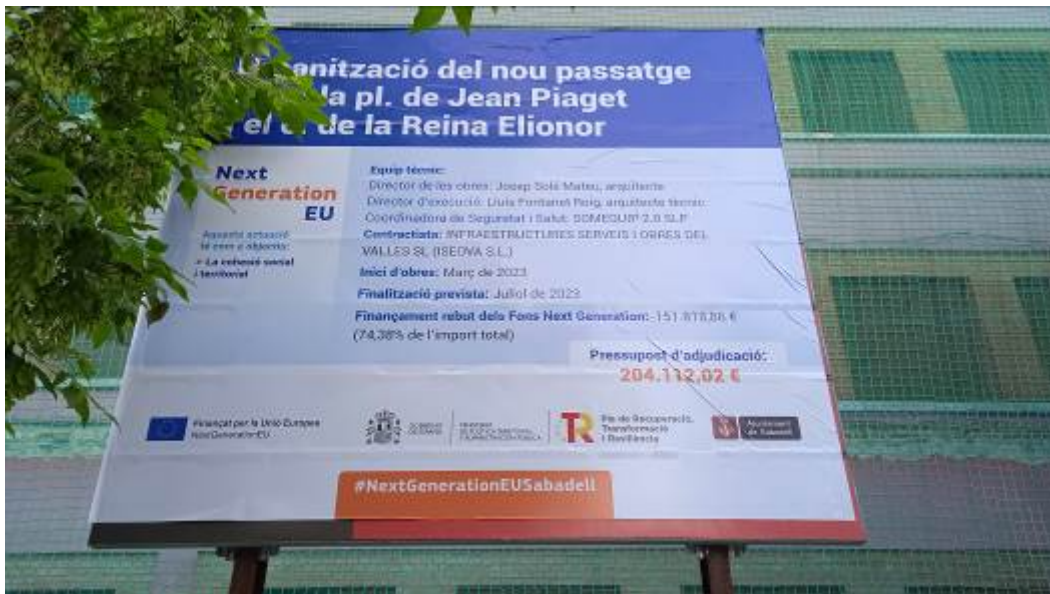
Imagen del cartel de obra