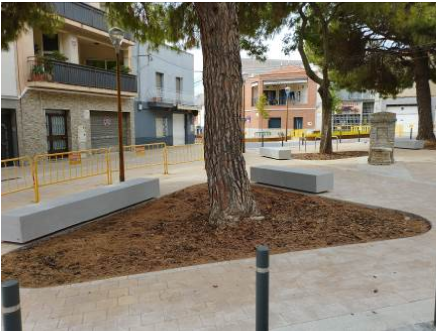
Imagen final de la actuación