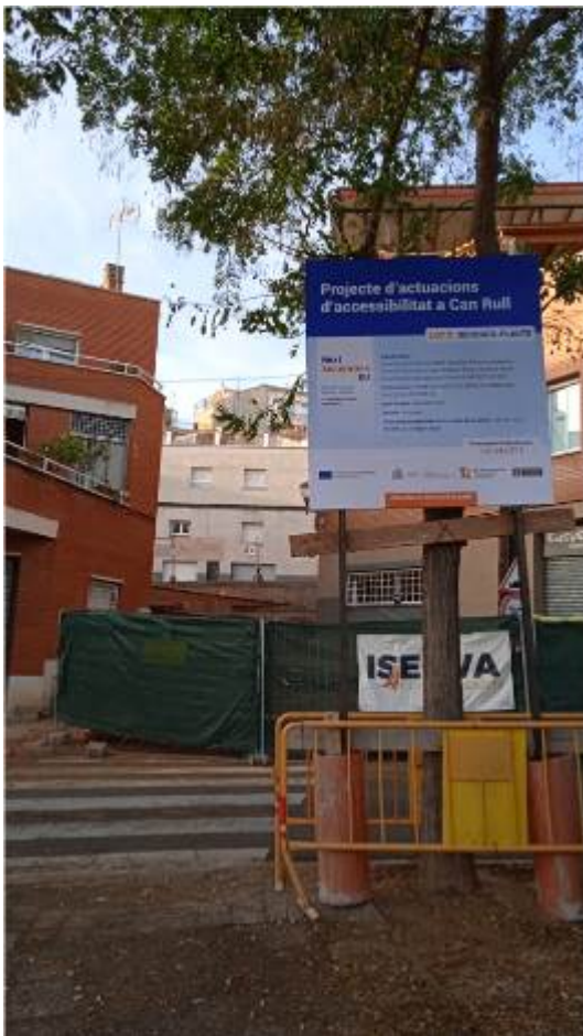
Imagen cartel de obra