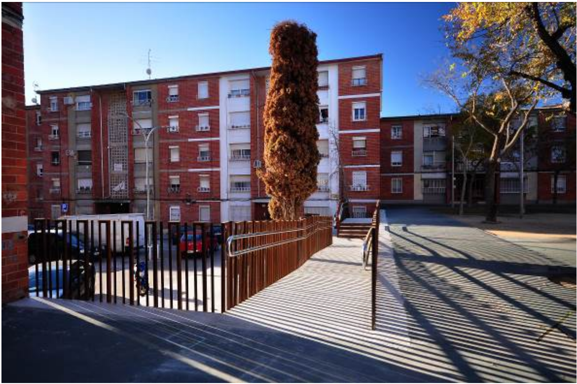
Imagen final actuación