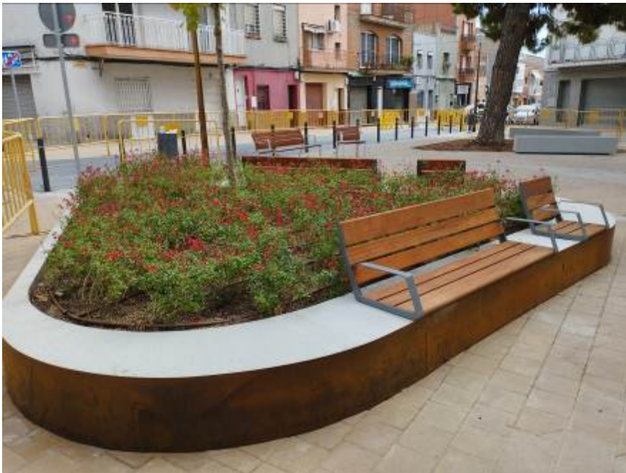
Imagen final de la actuación