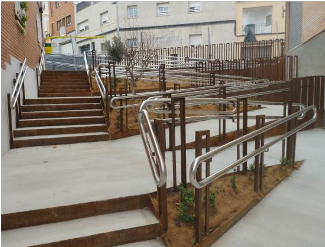
Imagen final actuación