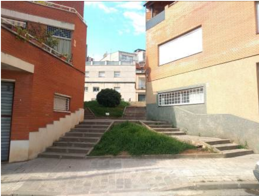
Imagen previa actuación