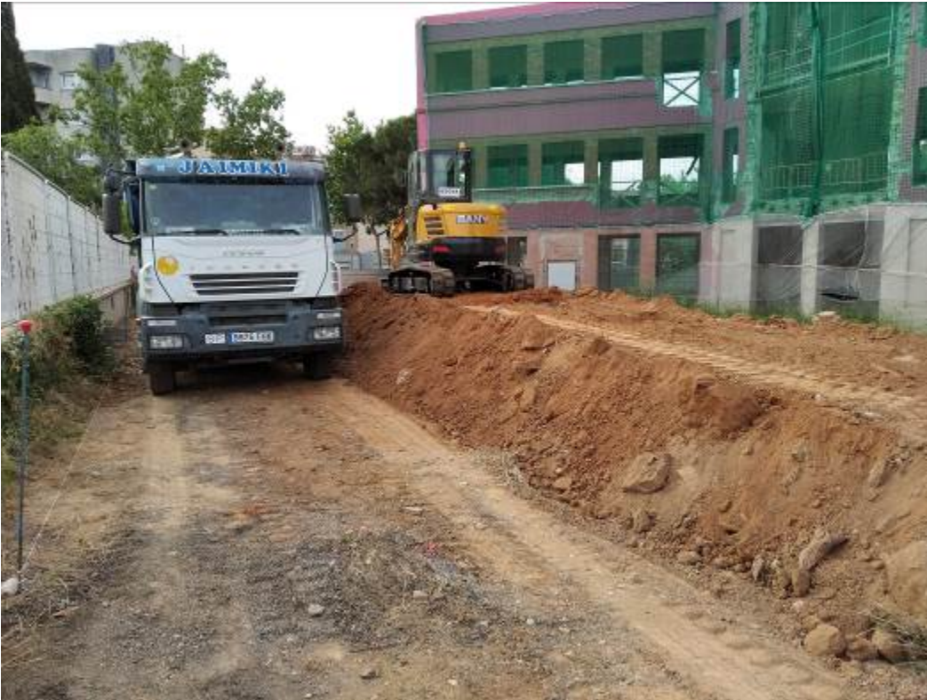
Imagen previa a la actuación