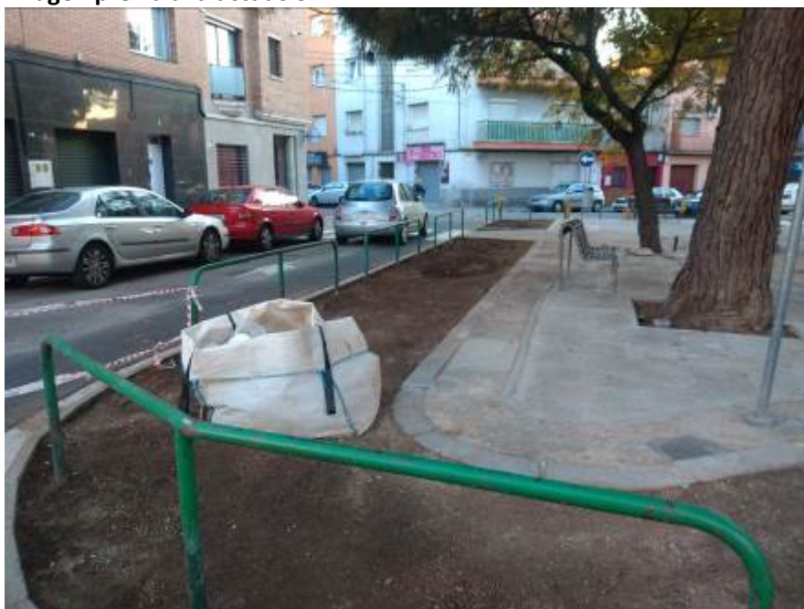
Imagen previa a la actuación