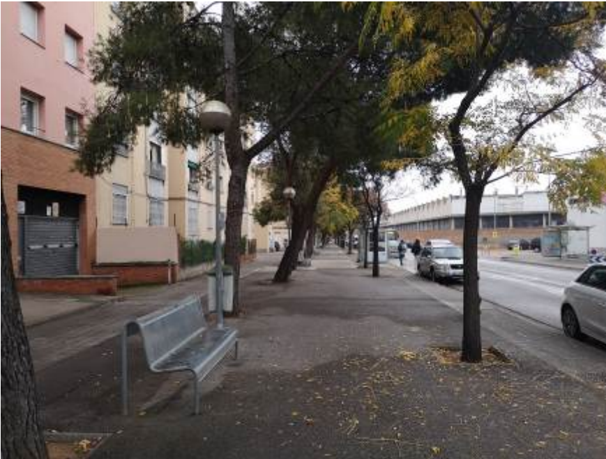
Imagen previa a la actuación