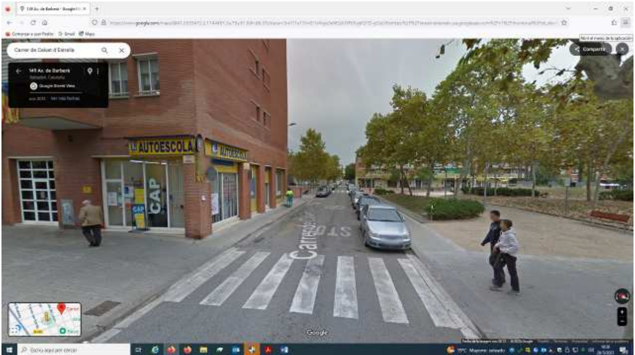
Imagen previa a la actuación

PROYECTO EJECUTIVO DE URBANIZACIÓN DE UN TRAMO DE LA CALLE DE CALVET ESTRELLA DE SABADELL (OTU/2021/88-OTU/2022/367)