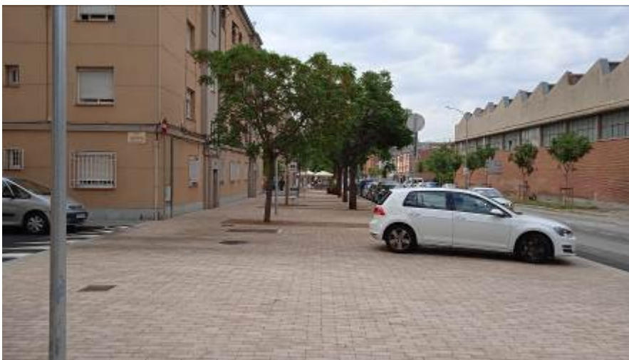
Imagen final de la actuación