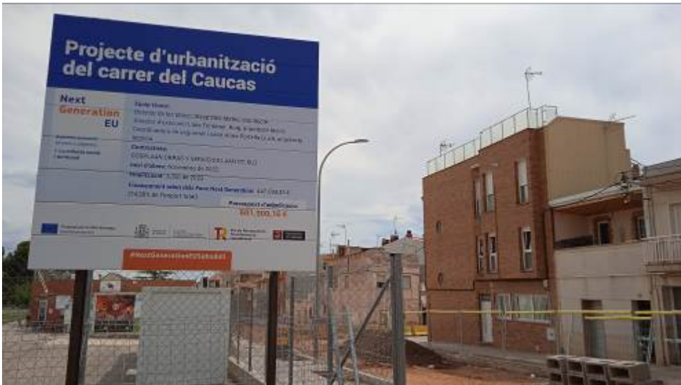
Imagen cartel de obra