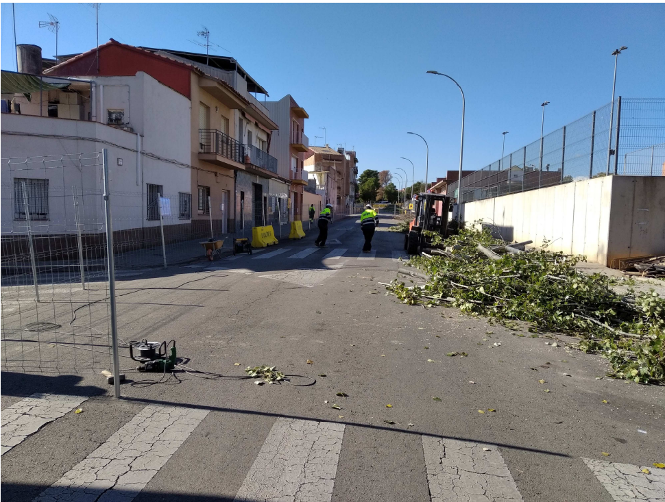
Imagen previa a la actuación