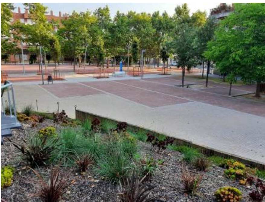
Imagen final de la actuación