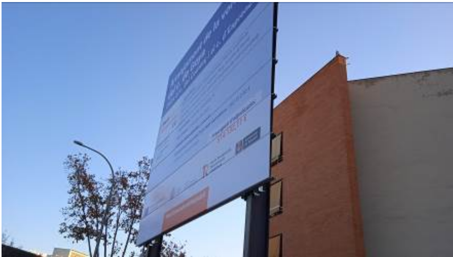
Imagen del cartel de obra