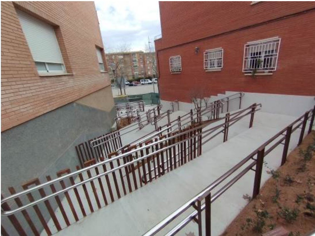
Imagen final actuación