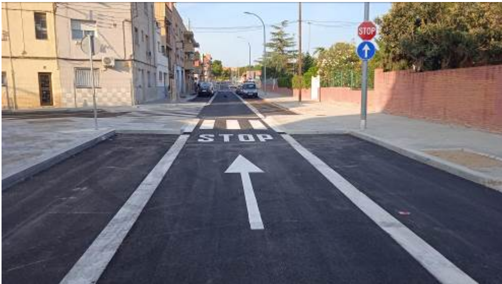
Imagen final actuación