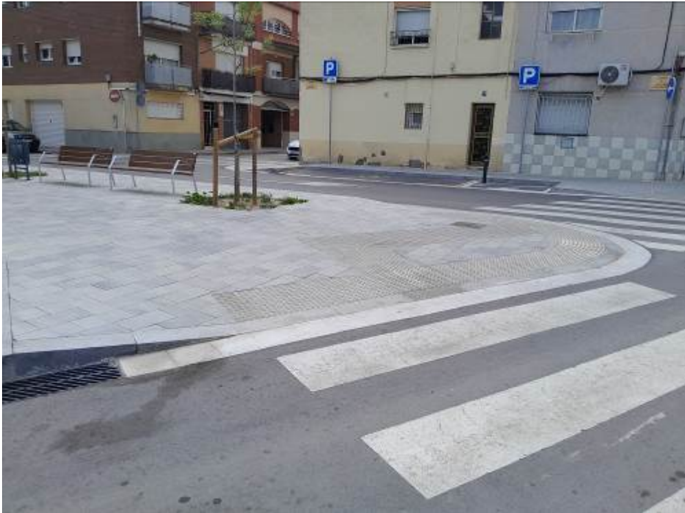
Imagen final actuación