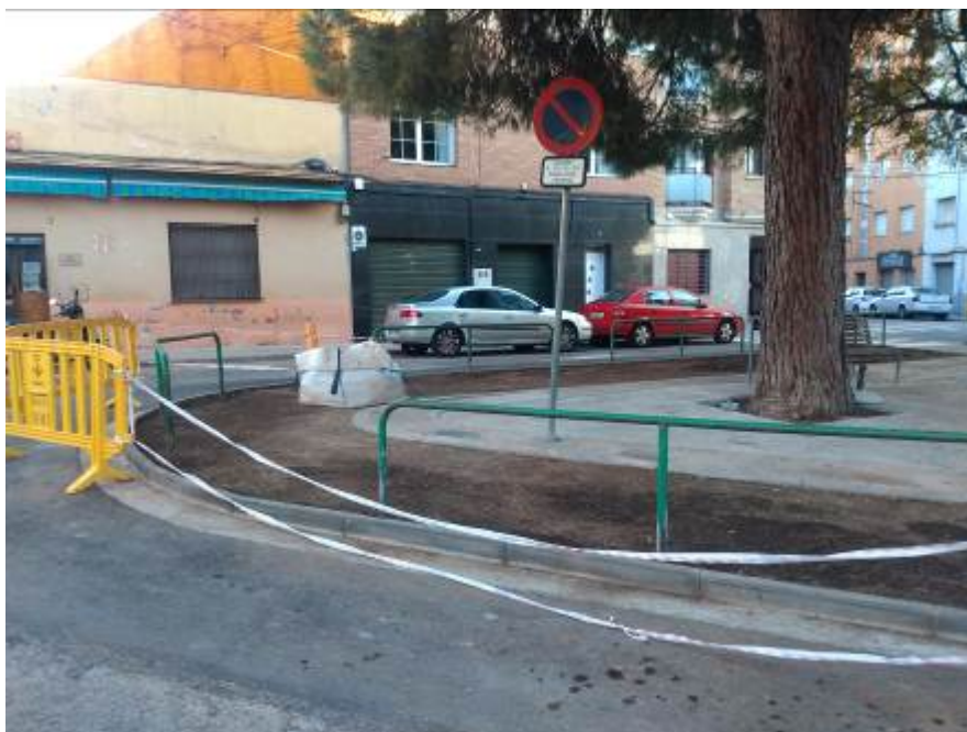
Imagen previa a la actuación