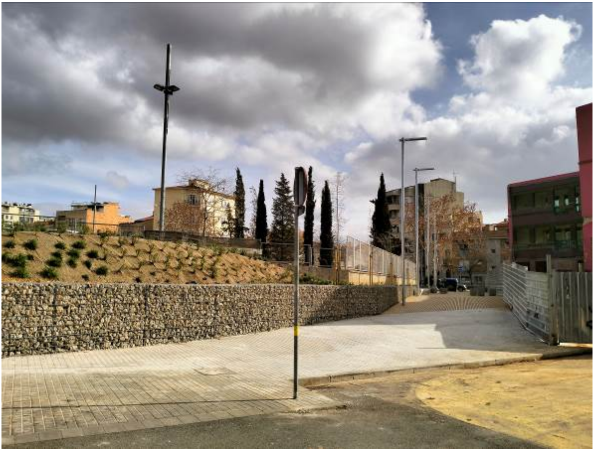
Imagen final de la actuación