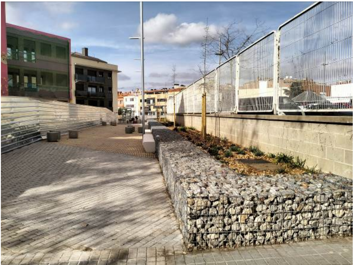
Imagen final de la actuación