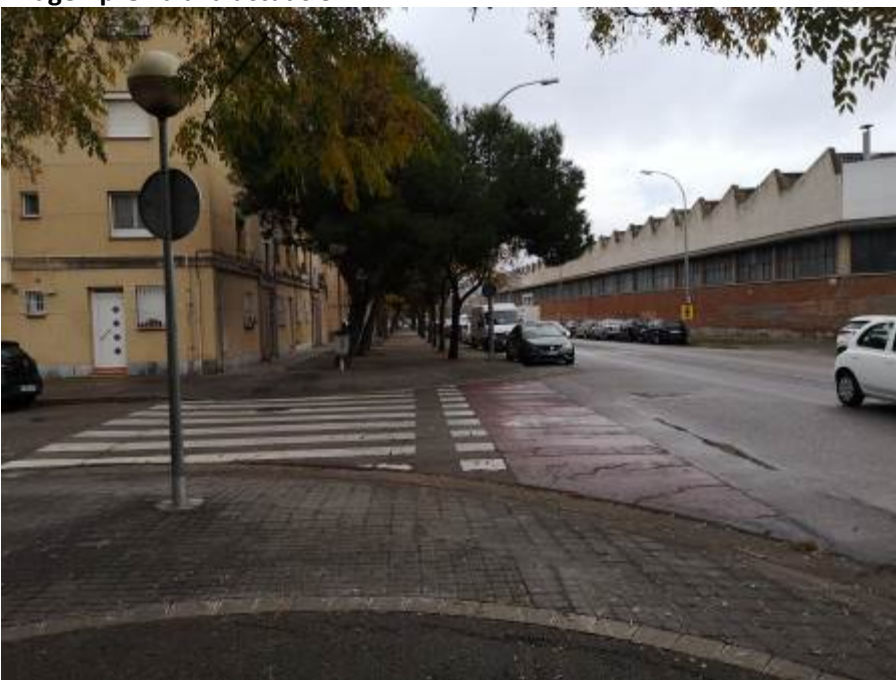
Imagen previa a la actuación