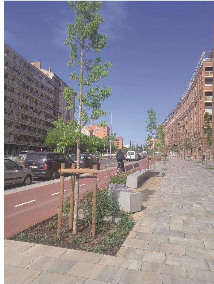
P6_L2-20210927-1 Adecuación zonas e itinerarios peatonales y ciclistas y mejora permeabilidad Gran Vía – Balcó Ripoll Nº de expediente: PRTRMU-21-00205