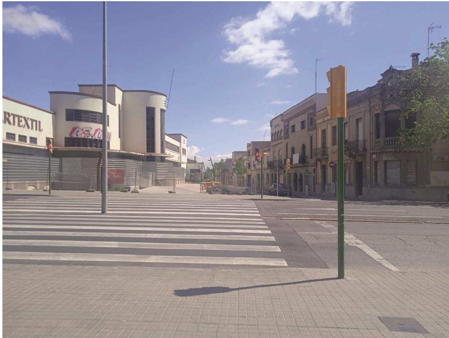
P6_L2-20210927-1 Adecuación zonas e itinerarios peatonales y ciclistas y mejora permeabilidad Gran Vía – Balcó Ripoll Nº de expediente: PRTRMU-21-00205