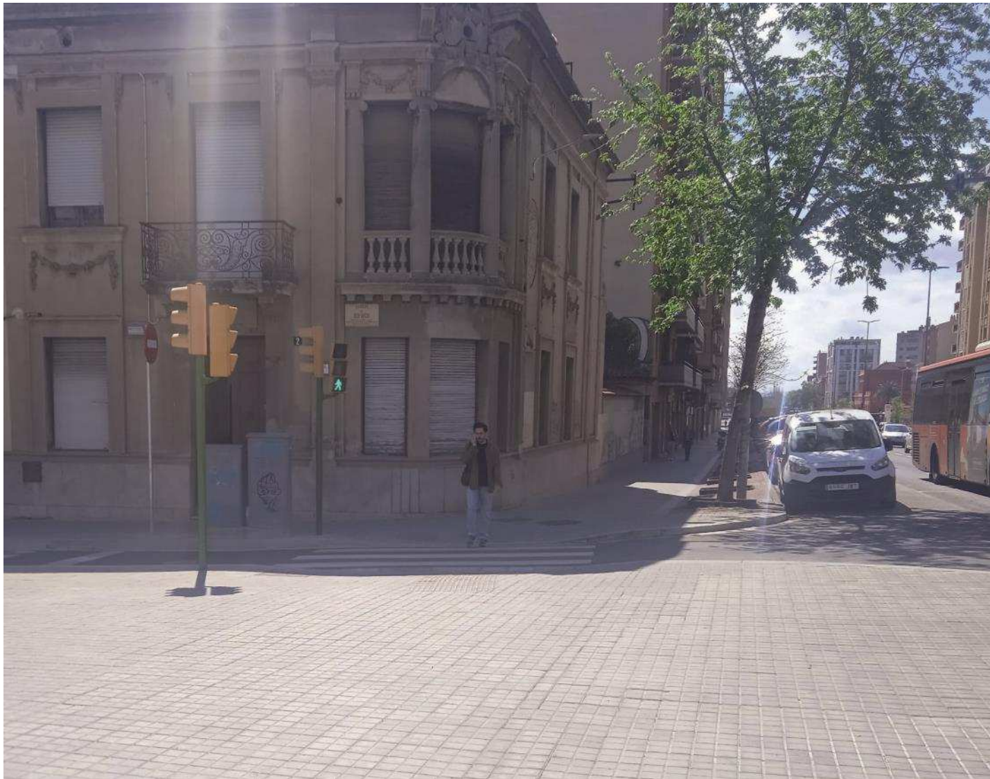
P6_L2-20210927-1 Adecuación zonas e itinerarios peatonales y ciclistas y mejora permeabilidad Gran Vía – Balcó Ripoll Nº de expediente: PRTRMU-21-00205