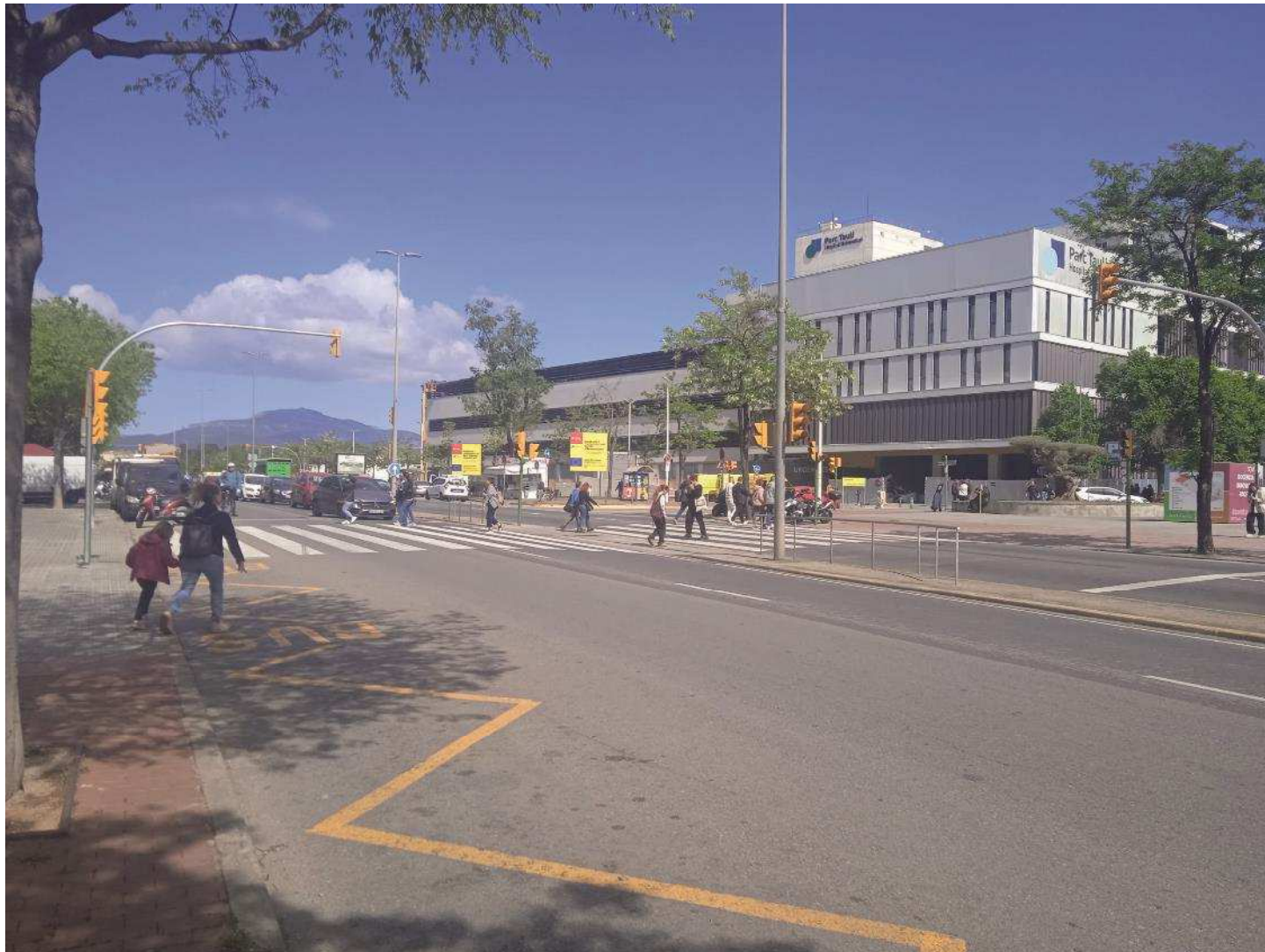
P6_L2-20210927-1 Adecuación zonas e itinerarios peatonales y ciclistas y mejora permeabilidad Gran Vía – Balcó Ripoll Nº de expediente: PRTRMU-21-00205