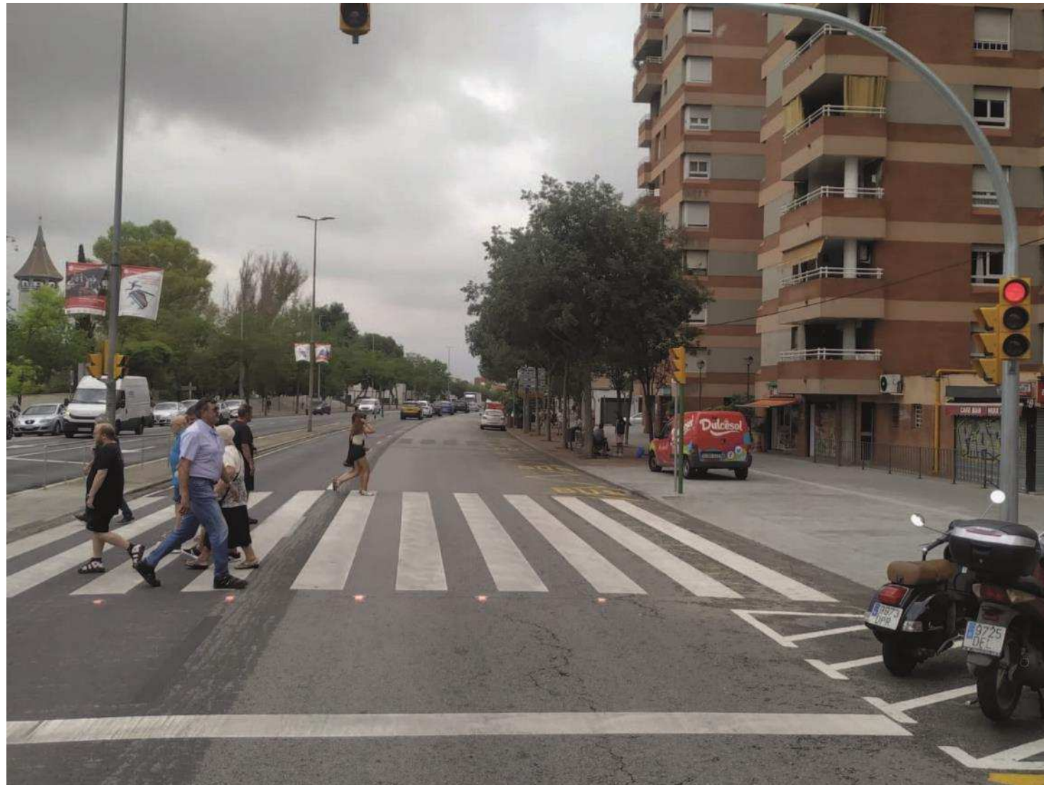
P6_L2-20210927-1 Adecuación zonas e itinerarios peatonales y ciclistas y mejora permeabilidad Gran Vía – Balcó Ripoll Nº de expediente: PRTRMU-21-00205