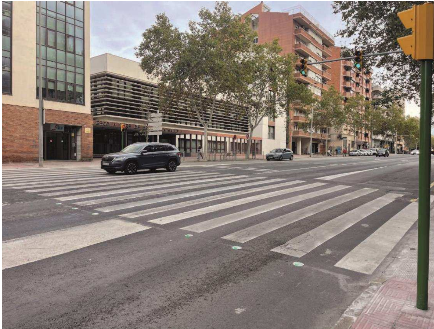
P6_L2-20210927-1 Adecuación zonas e itinerarios peatonales y ciclistas y mejora permeabilidad Gran Vía – Balcó Ripoll Nº de expediente: PRTRMU-21-00205