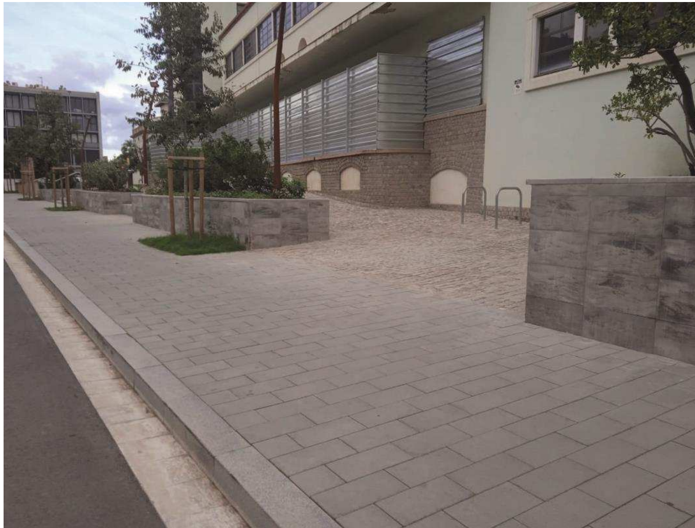
P6_L2-20210927-1 Adecuación zonas e itinerarios peatonales y ciclistas y mejora permeabilidad Gran Vía – Balcó Ripoll Nº de expediente: PRTRMU-21-00205