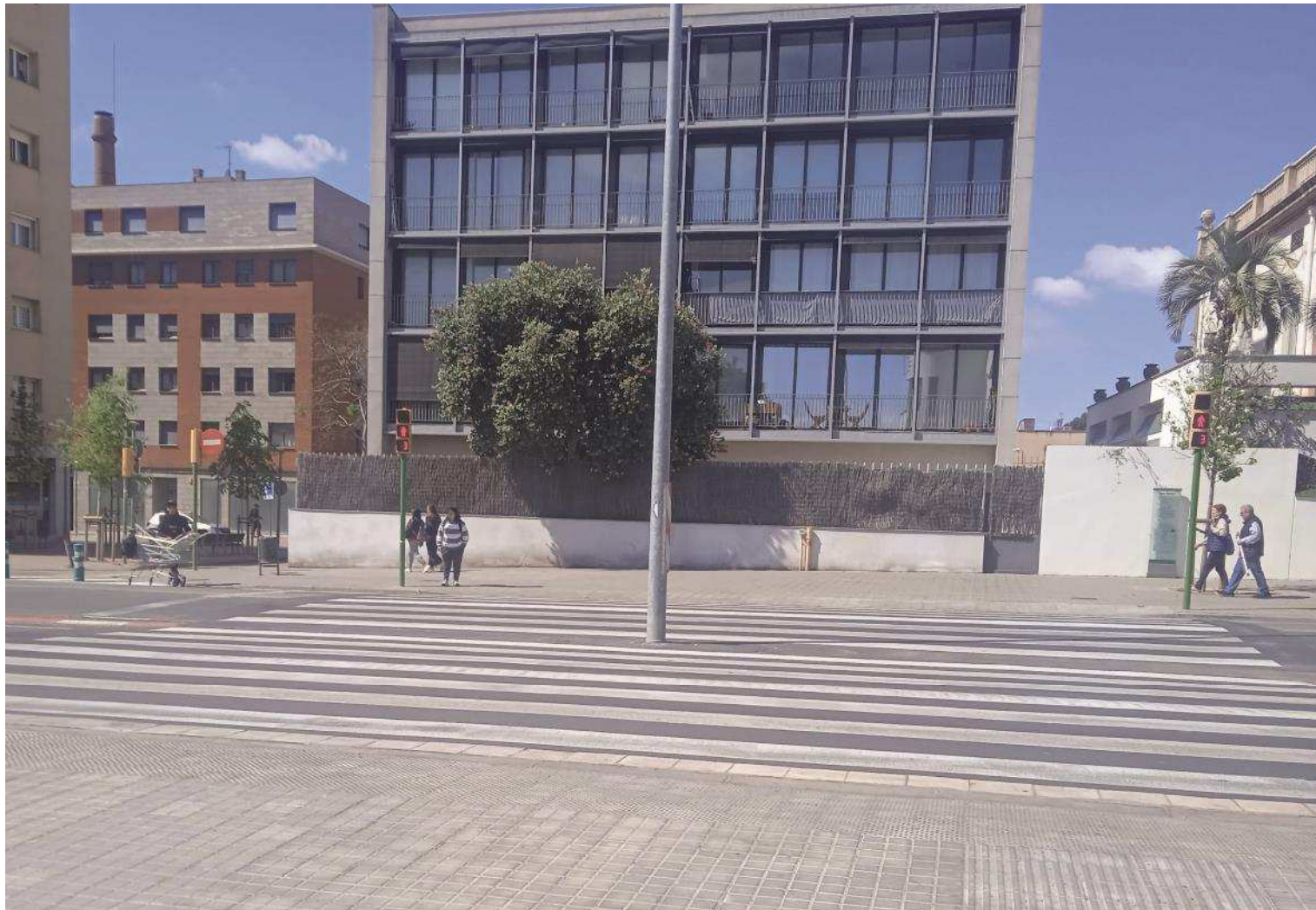
P6_L2-20210927-1 Adecuación zonas e itinerarios peatonales y ciclistas y mejora permeabilidad Gran Vía – Balcó Ripoll Nº de expediente: PRTRMU-21-00205