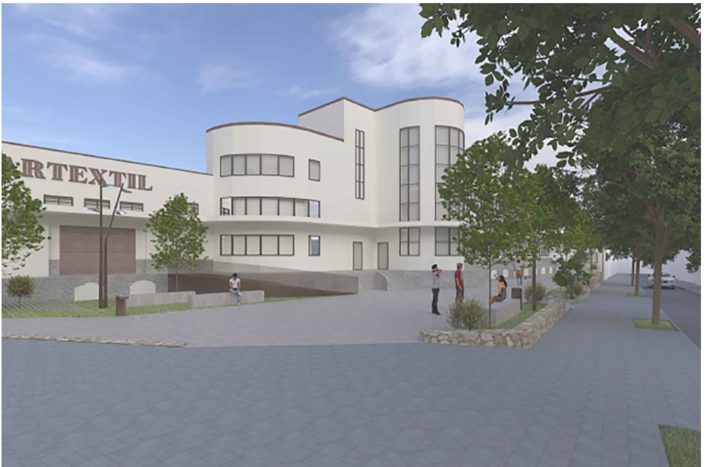
La recreació del futur espai

08:00 | ( https://www.naciodigital.cat/sabadell/pdf.php?id=36224&bdconf= )