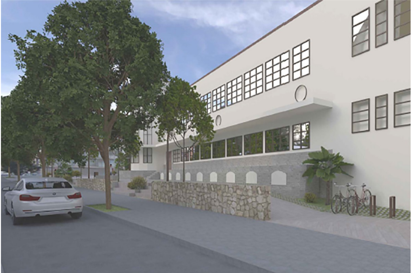
L'aspecte previst al llarg del carrer Quevedo

El projecte de reforma no contempla cap actuació a l'Artèxtil i és que, en cas que fos així, "caldrà redactar un estudi patrimonial", perquè es tracta d'un edifici inclòs en el Pla Especial de Protecció de Patrimoni de Sabadell (PEPS), el qual, segons qualifica, es troba en "bon estat" i que s'intervé quan és necessari.