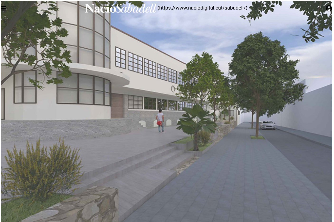
El tram del carrer Quevedo

Així mateix, i el que serà l'obra principal, es crearà un espai a l'antic pati amb l'eliminació de les tanques que hi ha en aquests moments a l'exterior d'aquest edifici emblemàtic de la ciutat i que permetrà l'estada i passeig de la ciutadania . A més, s'hi incorporaran embornals i jardineres, es plantaran arbres i s'hi posarà nou mobiliari o serà reaprofitat.