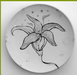
RAMON PUIG "WERENS"